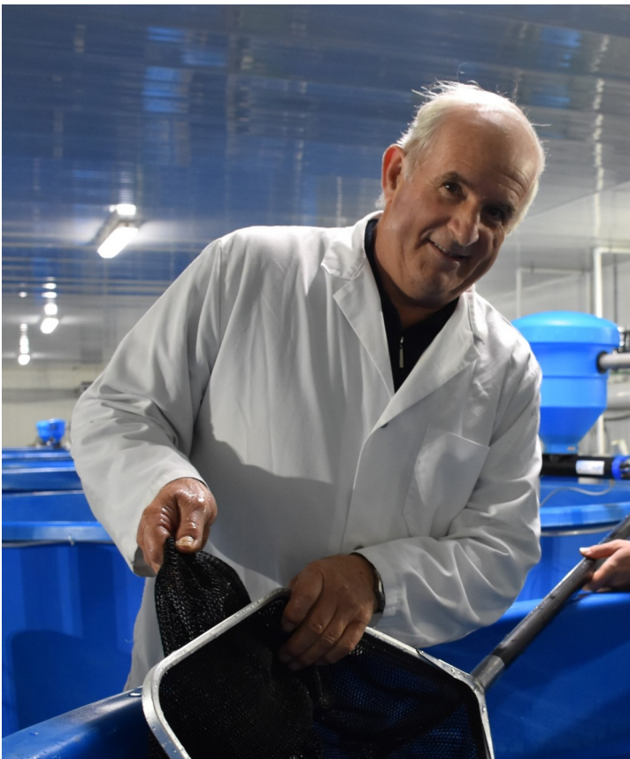
Photo de l'endos